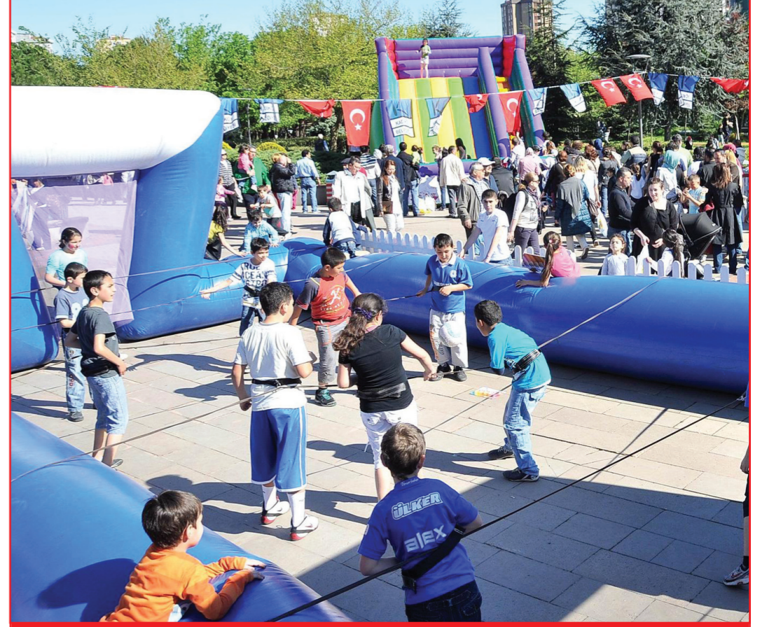
23 Nisan Ulusal Egemenlik ve Çocuk Bayramı, ilçemiz Kadıköy'de de coşkuyla kutlandı. Bağdat Caddesi, Özgürlük Parkı ve Fenerbahçe Şükrü Saraçoğlu Stadı'nda renkli görüntüler vardı.